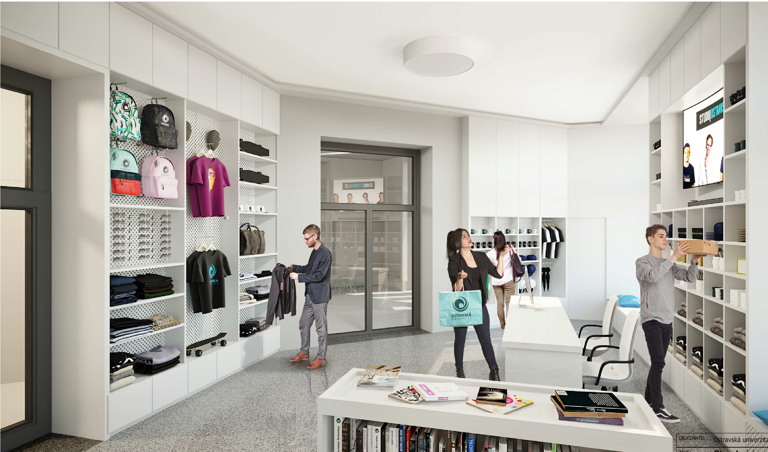
SO01 - 1NP 1.2